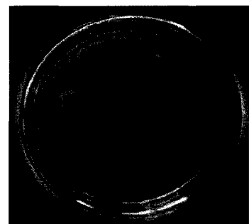
图 2 复方中草药 HC-F、HC-G、HC-H 和 HC-I 对假交替单胞菌(JJT)有更明显的抑菌圈

由表 6 分析知,复方中草药 H-5、H-6、H-9 和 H-14 分别为 20、10、30 和 20 mg/ml 时,其抑菌圈平均直径分别达最大值,即为 15.25、12.67、13.50 和 13.25 mm。复方最佳配比即为 H-5 : H-6 : H-9 : H-14 = 2 : 1 : 3 : 2。